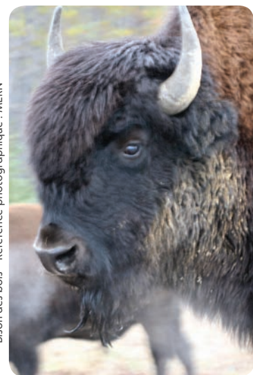
Bison des bois