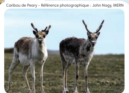
Caribou de Peary