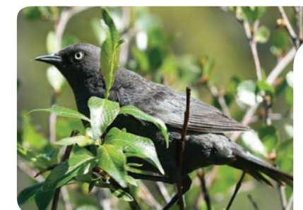
Quiscale rouilleux

Vous trouverez plus de renseignements sur les activités de la Conférence dans le site Web sur les espèces en péril aux TNO au www.nwtspeciesatrisk.ca