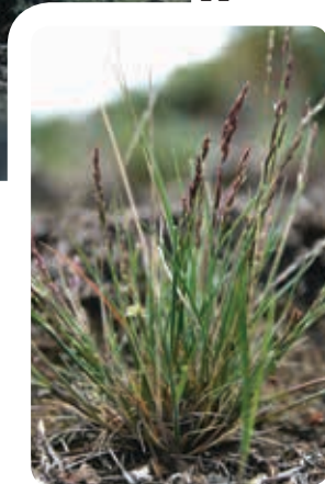
Zigadène élégant de l'île Banks