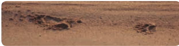
Empreintes de grizzly