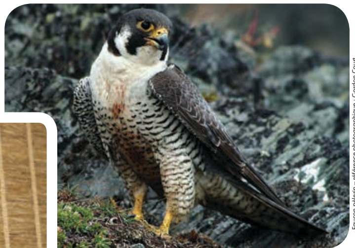
Falcon pèlerin