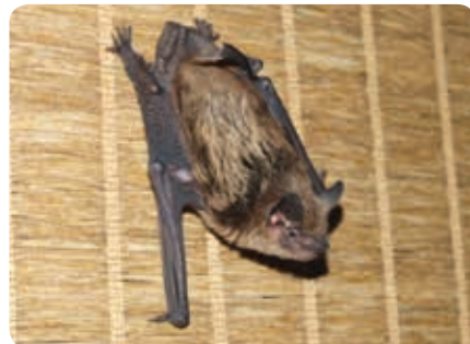
Sérotine brune

Tous les documents du Comité sur les espèces en péril, y compris les rapports de situation et les évaluations des espèces, sont disponibles sur le site Web sur les espèces en péril des TNO au www.nwt-species-at-risk.ca .