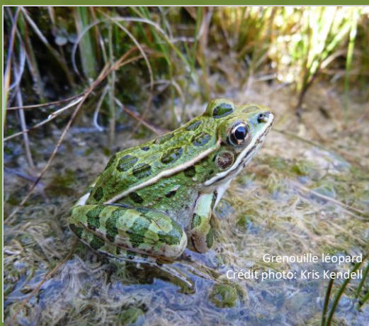
Grenouille léopard

Le Fonds pour la conservation et le rétablissement des espèces des TNO se concentre sur la conservation et le rétablissement des espèces en péril. Afin de mettre l'accent sur les mesures visant directement le rétablissement, les projets recevront du financement en fonction du système de niveau de priorité. Les priorités ont été établies selon le lien des projets avec les programmes de rétablissement ou les plans de gestion, les espèces ciblées et l'objectif principal des projets.