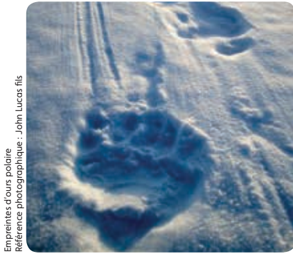
Empreintes d'ours polaire

En vertu du paragraphe 16(1) de la Loi sur les espèces en péril (TNO) , la Conférence des autorités de gestion (la Conférence) doit présenter un rapport annuel au ministre de l'Environnement et des Ressources naturelles au plus tard le 30 septembre de chaque année. Le présent rapport annuel vise l'exercice se terminant le 31 mars 2015.