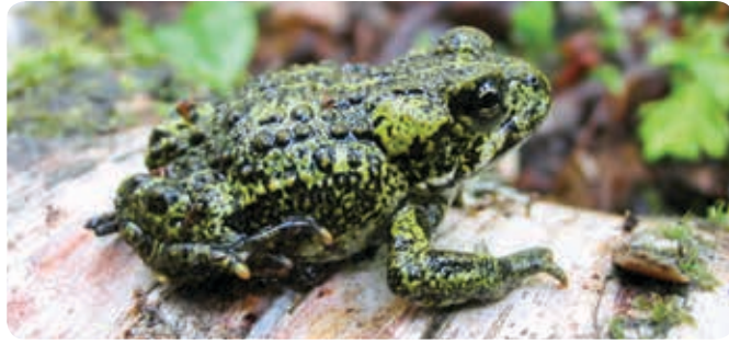
Crapaud de l'Ouest