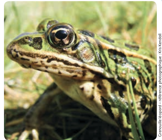
Grenouille léopard – référence photographique : Kris Kendall