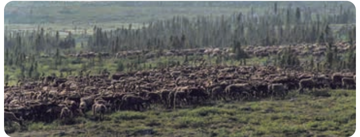
Caribou de la toundra

La Loi sur les espèces en péril (TNO) [ci-après la « Loi »] prévoit un processus pour identifier, protéger et rétablir les espèces en péril aux Territoires du Nord-Ouest (TNO). La Loi s'applique à toute espèce sauvage animale ou végétale qui est gérée par le gouvernement des TNO. Elle s'applique dans la plupart des régions des TNO, tant sur les terres publiques que privées, y compris les terres privées visées par un accord de revendications territoriales.