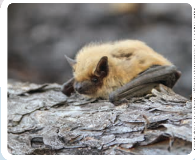
Grande chauve-souris brune