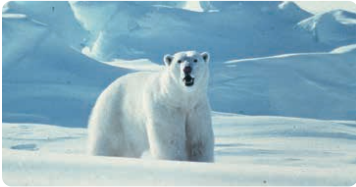
Ours polaire

Conformément au paragraphe 16(1) de la Loi sur les espèces en péril (TNO) , la Conférence des autorités de gestion (ci-après la « Conférence ») doit présenter un rapport annuel au ministre de l'Environnement et des Ressources naturelles au plus tard le 30 septembre de chaque année. Le présent rapport annuel vise l'exercice se terminant le 31 mars 2020.