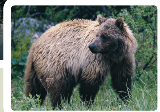
Grizzli - Référence photographique : Gordon Court