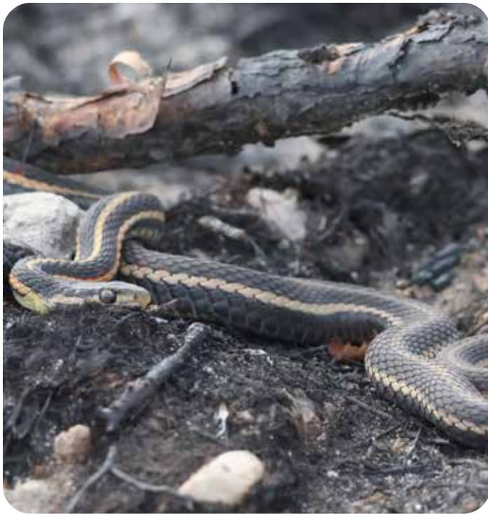
Couleuvre rayée à flanc rouge

La Loi sur les espèces en péril (TNO) [la Loi] prévoit un processus pour identifier, protéger et rétablir les espèces en péril aux Territoires du Nord Ouest (TNO). La Loi s'applique à toute espèce sauvage animale ou végétale qui est gérée par le gouvernement des Territoires du Nord-Ouest. En outre, elle s'applique dans la plupart des régions des TNO, tant sur les terres publiques que sur les terres privées, y compris les terres privées visées par un accord de revendications territoriales.