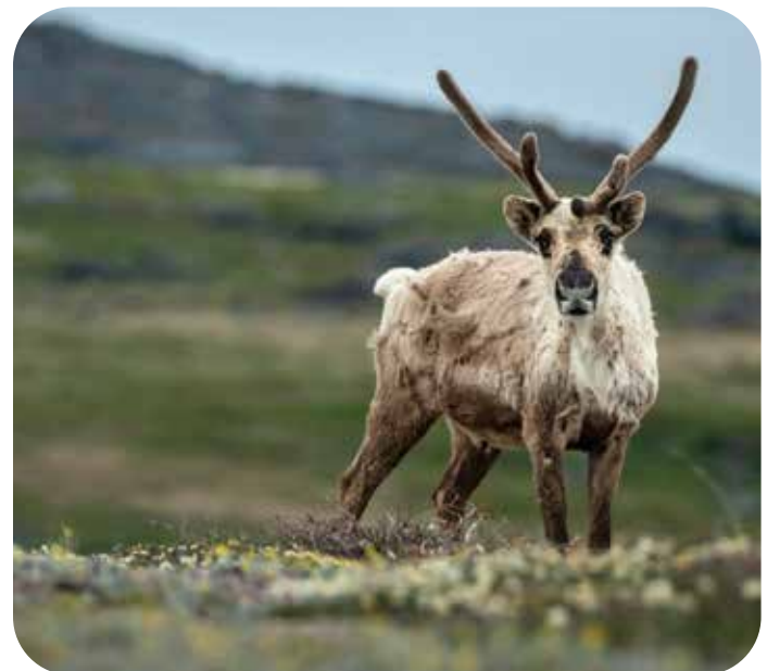
Caribou de la toundra, harde de Bathurst

Le Comité sur les espèces en péril reçoit l'ensemble de son soutien administratif et financier du ministère de l'Environnement et du Changement climatique du gouvernement des Territoires du Nord Ouest. Les avis de contrats pour la rédaction des rapports de situation des espèces sont publiés au contracts.opennwt.ca .