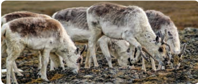
Caribou de Peary

Conformément au paragraphe 16(1) de la Loi sur les espèces en péril (TNO) , la Conférence des autorités de gestion (ci-après la « Conférence ») doit présenter un rapport annuel au ministre de l'Environnement et des Ressources naturelles au plus tard le 30 septembre de chaque année. Le présent rapport annuel vise l'exercice se terminant le 31 mars 2019.