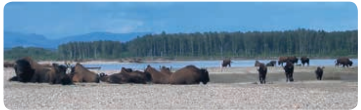
Bison des bois

La Loi sur les espèces en péril (TNO) [ci-après la « Loi »] fournit un processus pour cerner, protéger et rétablir les espèces en péril aux Territoires du Nord-Ouest (TNO). La Loi s'applique à toute espèce sauvage animale ou végétale qui est gérée par le gouvernement des TNO. Elle s'applique dans la plupart des régions des TNO, tant sur les terres publiques que privées, y compris les terres privées visées par un accord de revendications territoriales.