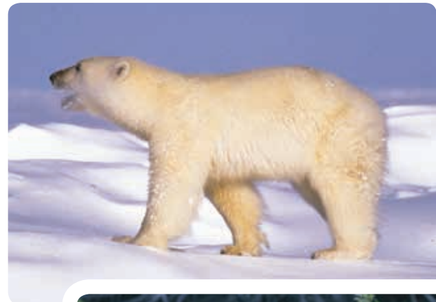
Ours polaire